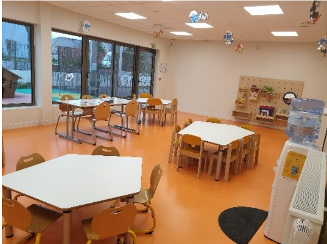
Salle activité maters