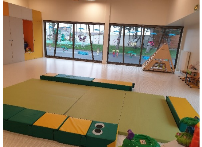
salle motricité maters